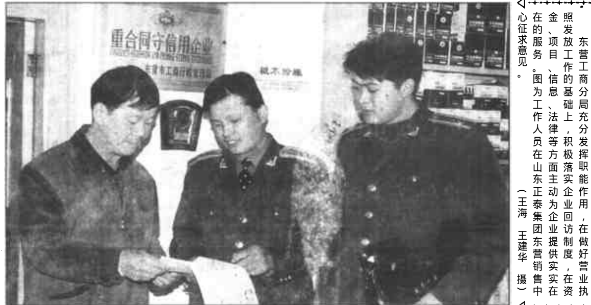
在照发放工作的基础上，积极发挥职能作用，在做好营业中，在资

关心的财务收支、人事管理、职工福利、收费标准、奖惩办法等40个项目上墙。他们还设立了《办事效率监督卡》，上面注明了受理日期、时限等事项，前来办事的人可以持卡作为对承办人办事效率和服务质量进行监督检查的凭证。对延误办事时限的承办人要批评教育、责令检查，甚至通报全局，如办事人反馈为批评意见三次者，即调离岗位。严格的制度确保了服务的质量，截至目前，他们共审批招商引资项目10个，其它建设项目6个，处理污染事故46起，检查排污申报登记情况、排污许可证执行情况共计40余次，均优质、高效、快捷地办理，树立了严格执法、热情服务的良好部门形象。（陈学慧 陈学义）