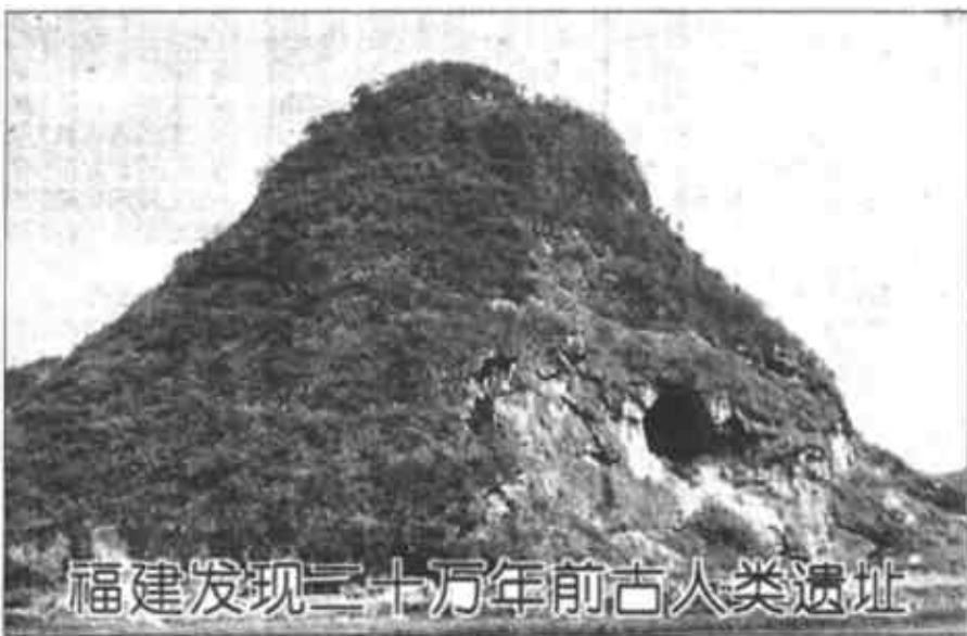
福建发现二十万年前古人类遗址

经过考古工作者一年多的发掘,福建省三明市万寿岩洞穴中一个二十万年前的旧石器时代早期人类活动遗址初现端倪。这处遗址包括灵峰洞、船帆洞、龙潭洞及周边洞穴,总面积1200多平方米,目前已对灵峰洞、船帆洞进行抢救性发掘,发掘面积400多平方米,出土石器制品800余件以及少量骨器、角器和一批哺乳动物化石。这一遗址不仅是华东地区迄今发现最早的洞穴类型的旧石器时代早期文化遗址,而且把古人类在福建生活的历史提早了十几万年,为研究中国东部旧石器时代文化提供了珍贵的实物资料。目前这一重大考古发现已通过国家文物局、中科院古脊椎动物与古人类研究所、北京大学等机构专家学者的论证鉴定。这是古人类活动遗址——万寿岩。